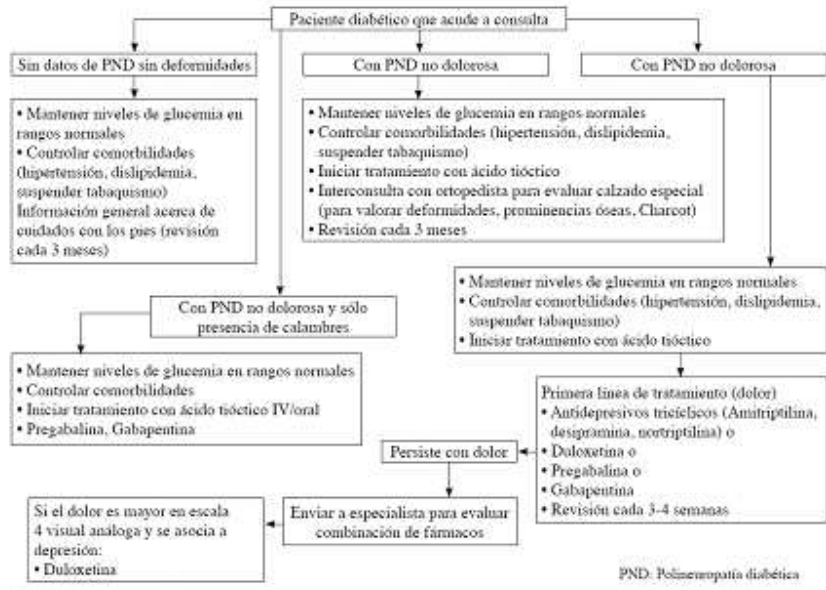
Algoritmo para el manejo del paciente con polineuropatía diabética