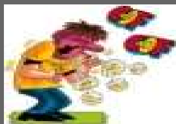
SOFOCACIÓN Ó DISNEA TERMINAL

pacientes terminales en situación de urgencia requieren la administración de algunos medicamentos ya sea vía subcutáneo o intravenosa, incluso para hidratación parenteral, así como contar con los recursos suficientes que permitan la mayor eficacia en el actuar, con conocimiento previo del avance de la enfermedad.