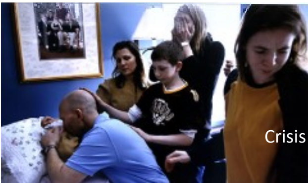
Crisis de claudicación familiar